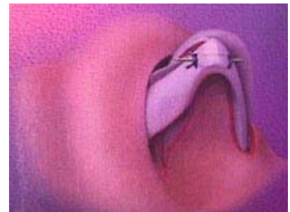
Figura 3- Tecniche di rimodellamento non distruttivo [da Tebbets JB, op. citata - © Mosby, Inc.]

La rinoplastica non distruttiva è utilizzabile in tutti i casi, ma trova particolare indicazione nelle correzioni più delicate della forma della punta nasale, o quando questa sia l'unica parte del naso su cui si desideri intervenire. Nelle revisioni di rinoplastiche "distruttive" che hanno fornito risultati insoddisfacenti la tecnica non distruttiva va in genere associata all'utilizzo di innesti cartilaginei di vario tipo.