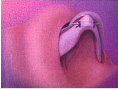
Figura 2 - Tecniche di rimodellamento non distruttivo [da Tebbets JB, op. citata - © Mosby, Inc.]

Il rimodellamento non distruttivo della punta del naso richiede l'effettuazione di una rinoplastica aperta . Quest'ultima consente l'accesso e la visualizzazione delle cartilagini in posizione di "riposo" (senza che debbano essere stirate all'esterno attraverso le incisioni della rinoplastica tradizionale), garantendo un'ottima precisione al prezzo di tempi operatori leggermente più lunghi (e costi, conseguentemente, leggermente superiori). Si tratta di una tecnica particolarmente recente, e non tutti i chirurghi che hanno lunga familiarità con le tecniche tradizionali possono essere disposti a cambiare radicalmente le proprie strategie chirurgiche.